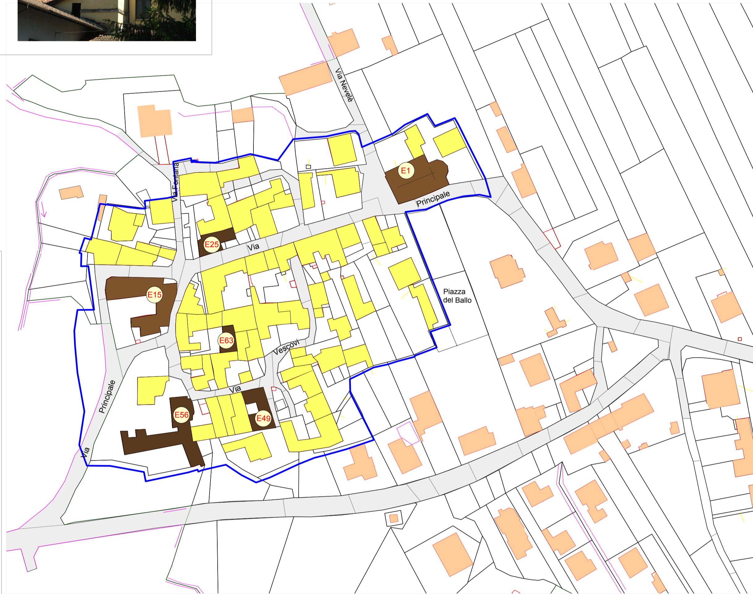
ESTRATTO PLANIMETRIA SU BASE CATASTALE